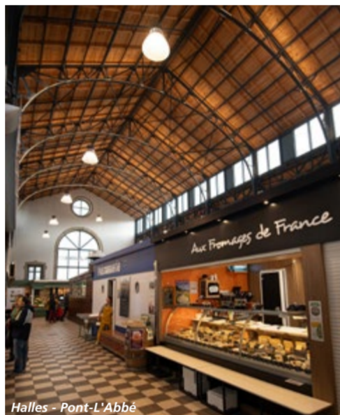
Halles - Pont-l'Abbé

Covered markets, the "Halles" in city centers During the Middle Ages, the "halles" were called "cohue", which means crowd in French and covered market in Breton. That's how central and busy these places were! They were often organized by corporations: the butchers, the fishermen and the bakers further away. Some were dedicated to a specific kind of business such as grain trade in Morlaix for example.