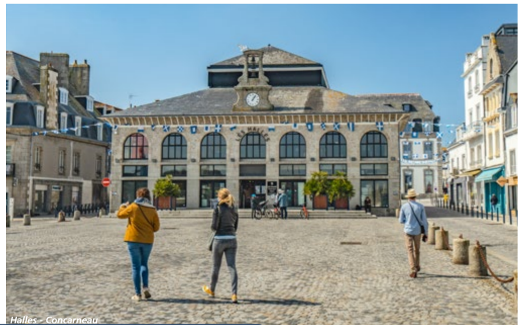
Halles - Concarneau

Plouescat compte parmi les dernières halles en bois de Bretagne. Construites à la fin du XVI e siècle, elles sont aujourd'hui classées Monument historique. Les halles de Quimperlé sont fer forgé et brique, avec des ornements en fonte et acier méritant le coup d'œil. Celles de Pont-l'Abbé sont elles aussi remarquables avec leur belle charpente de style Eiffel. Aujourd'hui, comme jadis, les halles demeurent un lieu incontournable, un lieu de rencontres et d'échanges où l'on a plaisir à flâner.